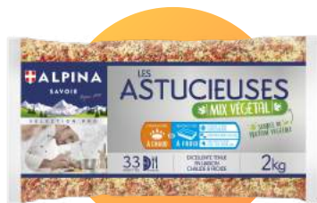
MIX PERLES, QUINOA, TOMATES SÉCHÉES ET ÉPICES DOUCES

En pilaf, le Mix délivre une texture fondante et savoureuse pour composer des plats chauds créatifs. Idéal pour préparer un risotto ou paëlla de Mix !