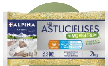
MIX PEPINETTES, POIS CASSES & BASILIC