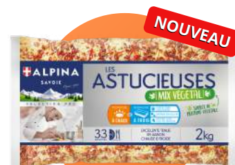
MIX CŒUR DE BLÉ, LENTILLES CORAIL, LENTILLES VERTES ET POIVRONS ROUGES