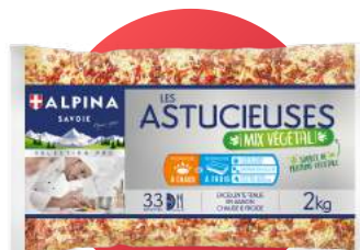
MIX PÉPINETTES, LENTILLES CORAIL ET TOMATES SÉCHÉES